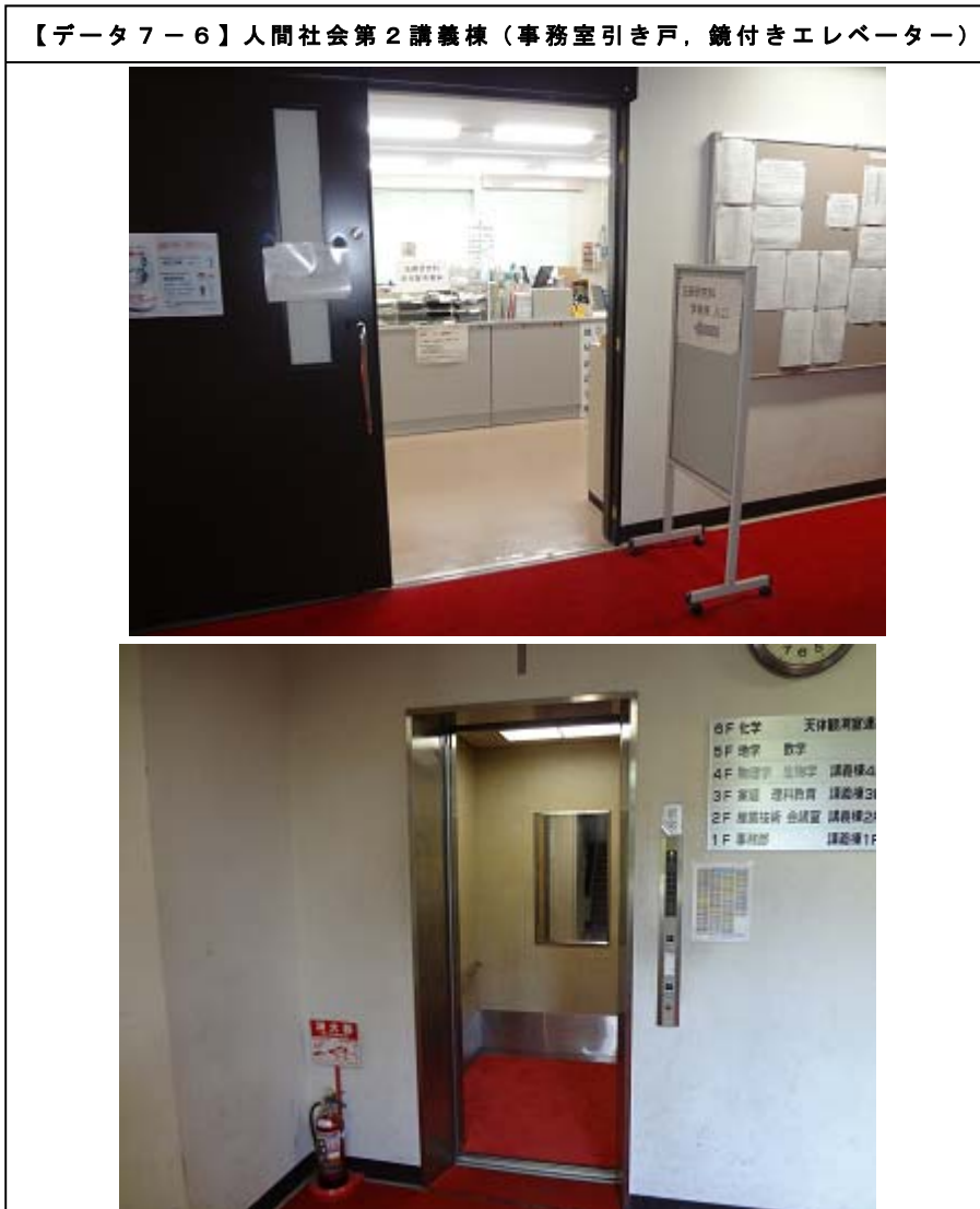
【データ 7-6】人間社会第 2 講義棟 (事務室引き戸、鏡付きエレベーター)

本研究科では、これまで、配慮が必要な身体障害のある入学者はいないが、視覚障害のある学生に対応する PC の導入や、聴覚障害のある学生への支援としてのノートテイク制度などについて、検討している。また、全学的に身体等に障害のある学生の支援を図るため、金沢大学障害学生支援委員会を設置しており、その委員会における支援施策の一環として、全学的に施設設備の整備が行われ、スロープ、手すり、車椅子のための鏡付きエレベーター、事務室等における引戸が設置されている。(データ 7-6) (別添資料 63: 人間社会第 2 講義棟バリアフリー写真)